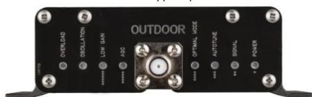
LED - индикация

Усилитель оборудован блоком, панелью с LED индикаторами, входом для внешней антенны ( OUTDOOR ), входом для внутренней антенны ( INDOOR ), разъемом питания ( Power ).